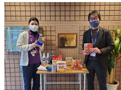
ドナルド・マクドナルド・ハウス「せたがやハウス」様 寄贈の様子