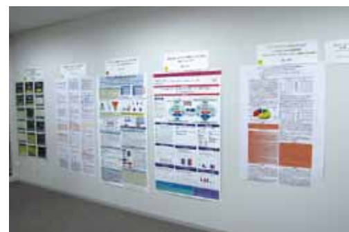
学位論文発表会におけるポスター発表の様子