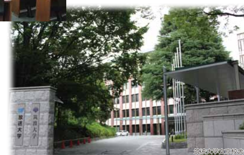
筑波大学文京校舎